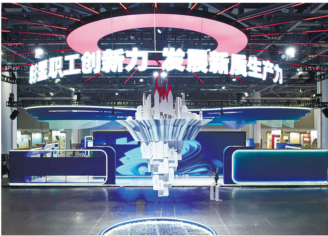
浙江省首届职工创新交流活动今天在杭州开幕。

发展的难题时，浙江系统提出了“八八战略”，其中蕴含的“优势论”指引着之江大地一次次爬坡过坎。如今，当进一步全面深化改革、推进中国式现代化的时代担当重任在肩时，浙江再次立足自身优势，聚力创新突破，勇挑发展“大梁”，为中国式现代化省域先行探路示范。