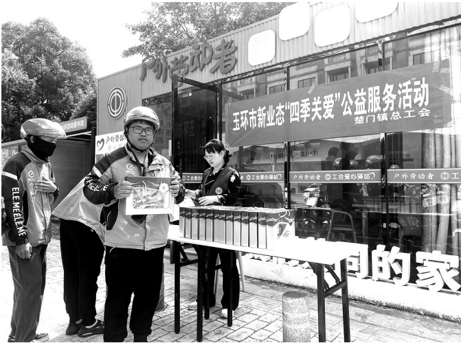
玉环工会在“爱心驿站”开展“四季关爱”公益服务活动。

通讯员董莉报道 随着互联网平台经济的快速发展,线上线下相融合的新业态新模式呈现出强大活力。在玉环,以外卖骑手、快递小哥、货运司机、护理护工员等为代表的新就业形态劳动者群体越来越庞大,如何让他们更好地感受到城市的温度,更有归属感和幸福感?近年来,玉环市总工会以贴“新”的实际行动,奋力书写暖“新”答卷。