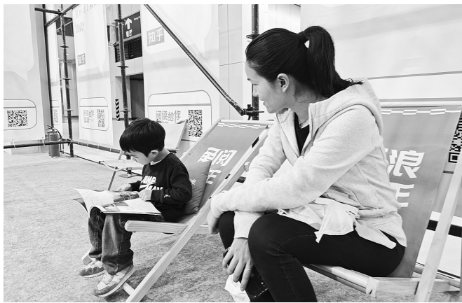
柳女士陪伴孩子看书。