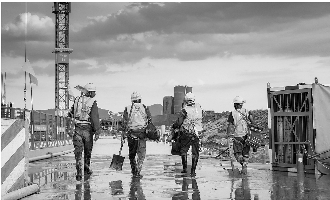
《中轴线上的铸造师》(组照选登)