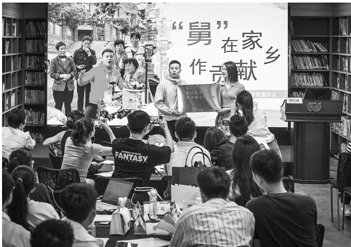
《“村播”点燃共富梦》(组照选登)