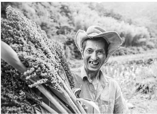
《丰收笑脸》(组照选登)