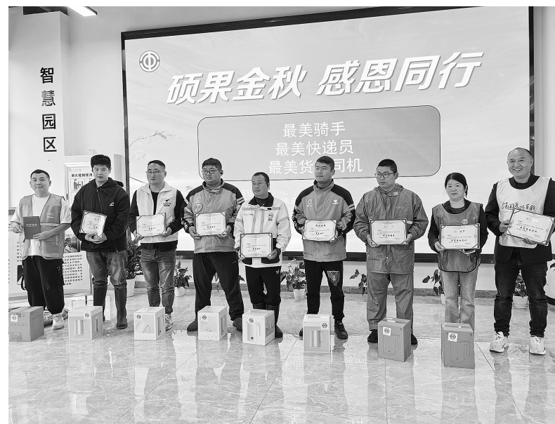
表彰活动现场。

新市镇总工会负责人表示,以平台经济为代表的新业态已逐步成为经济社会发展的新引擎,新就业形态劳动者既是美好生活的创造者、守护者,也是美好生活的追求者、共享者,工会要竭诚做好他们的思想引导和服务工作。接下来,工会将继续深化对新就业形态劳动者的关心关爱工作,探索更多有效的服务方式和手段,为他们创造更加良好的工作与生活环