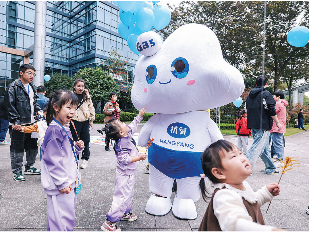
杭氧家属开放日现场,职工子女正在厂区参加游园活动。

发展历史、文化底蕴、精益技术和先进产品等。在临安工作的职工家属们还“零距离”“面对面”走进家属的工作单位、岗位,沉浸式了解家属的工作常态和鼎力支持。活动中,5名来自不同工作岗位的劳模工匠、优秀党员、技术技能人才与徒弟举行了集体“师徒”签约仪式,杭氧领导分别为10周年、20周年、30周年、到龄退休荣誉职工等颁发纪念章。职工家属们共同见证了这一激动人心的时刻。 随后,职工家属们集体参观了公司展示馆、游步道展区、透平公司。讲解员在参观途中给职工家属们简要介绍了杭氧的