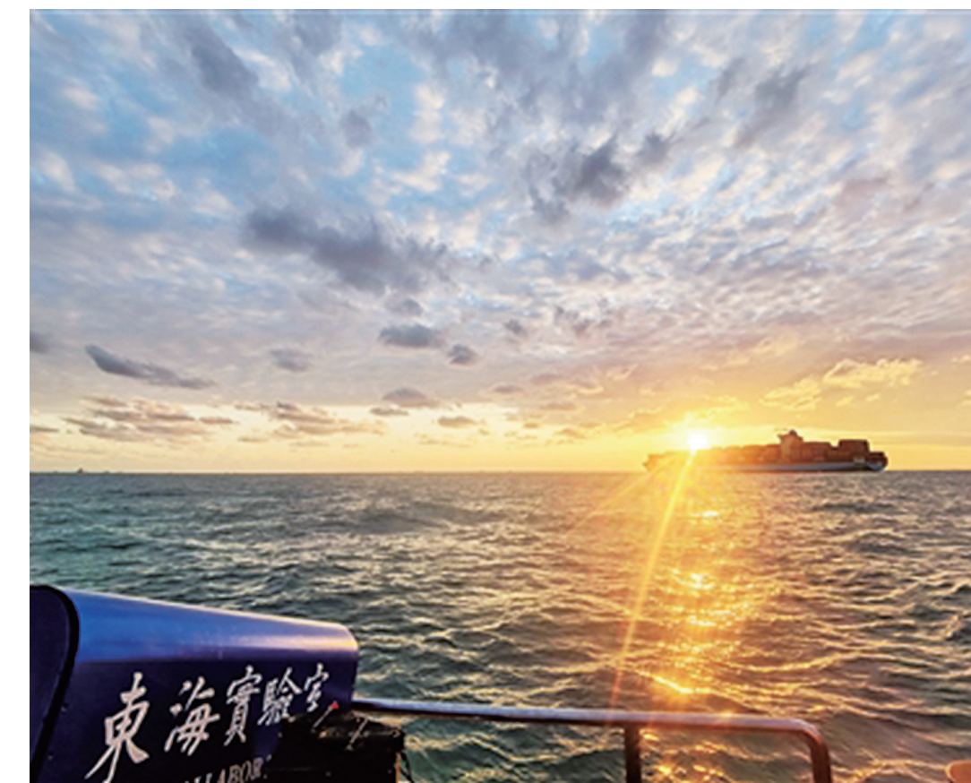
海试现场

本报讯 通讯员陈逸麟、虞一林报道 世界首台完全抗干扰激光雷达,日前在舟山首次海试并获得成功。 该激光雷达技术由东海实验室光学感知装备研发团队发明研制,拥有完全自主知识产权。海试团队在舟山东极以东海域,在晴天肉眼能见度不足两米的水质条件下,成功实现了探测水深近50米,充分验证了该技术在远海水质优良时探测深度超百米的可行性,为后续研究奠定了坚实基础。 据介绍,激光雷达是以发射激光脉冲探测目标特征量的遥感系统。其工作原理是向目标发射激光脉冲,然后将接收到的有时间信息的目标回波作适当处理后,就可获得目标的有关信息。 东海实验室研发的最新技术首次攻克了激光雷达受环境光干扰的全球性难题,可使激光雷达实现对大气与海洋的全天时观测。相关业内人士表