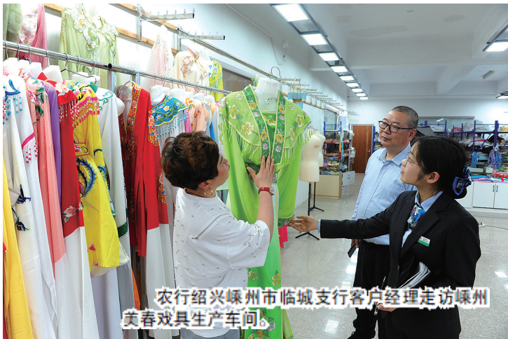
农行绍兴嵊州市临城支行客户经理走访嵊州美春戏具生产车间。

因缺乏资金和推广经验,不少非遗文化面临失传的风险。深入研究非遗文化面临的现实困境并采用金融手段及时帮扶,农行人的慧眼和坚守让非遗文化再度迎来“新生”。