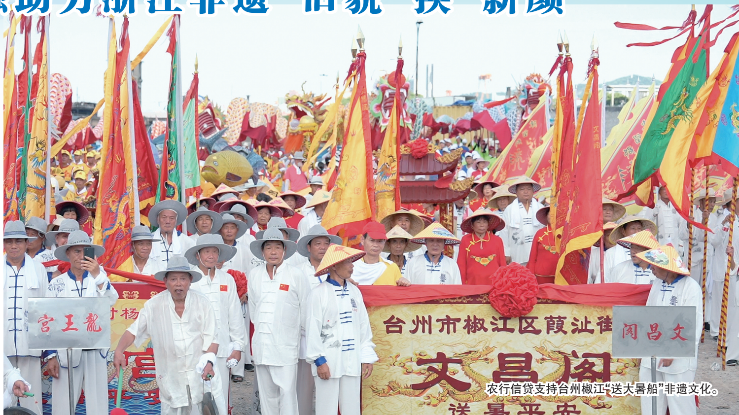
农行信贷支持台州椒江“送大暑船”非遗文化。

如何以金融之力做好非遗传承和焕新?农行浙江省分行立足服务“三农”使命担当,在关注社会经济发展的同时,积极投身于非遗文化的传承与保护,不断加大信贷资金投放力度,通过创新金融产品和服务,支持历史经典产业塑造新辉煌。