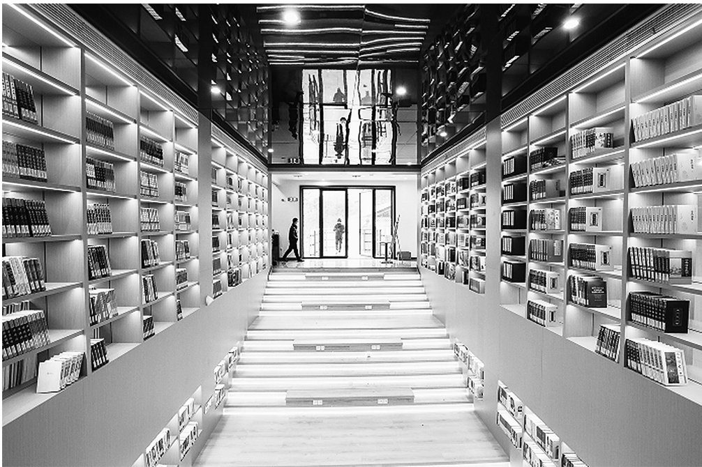
余村印象青年图书馆

这些公共文化共同体不仅提供了舒适的学习和交流环境,还成了青年人才和创意人才的聚集地,吸引了全国各地的青年前来安吉寻找灵感和发展机遇。接下来,安吉县